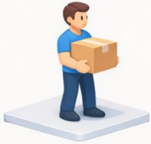
Nah am Körper halten