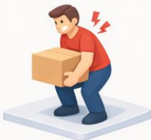
Schwere Last heben