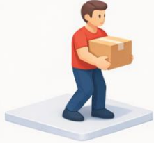
Weit vom Körper tragen