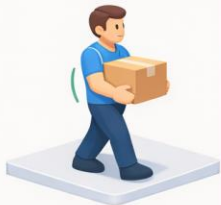
Rücken gerade halten