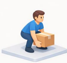
Mit den Beinen heben