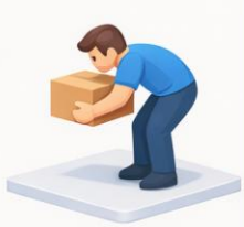
In der Taille beugen